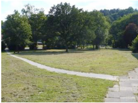
Foto 33 und Foto 34: Mögliche Flächen für weitere Sportangebote im Sportzentrum