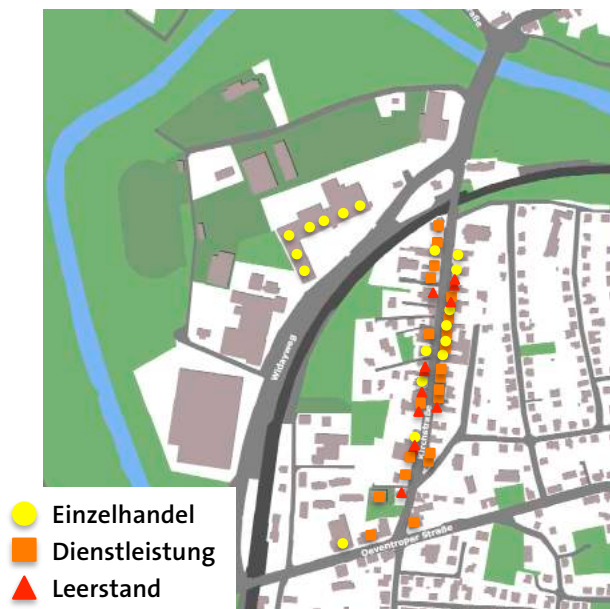
Karte 2: Bestandsituation in der Kirchstraße - März 2018