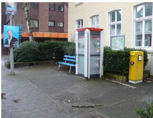
Foto 37 und Foto 38: Standorte von fehlenden Fahrradabstellanlagen in Oeventrop