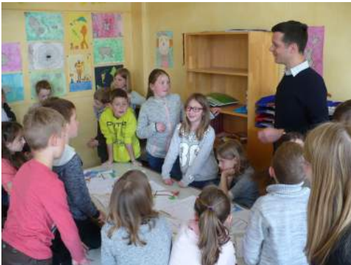
Foto 7 und Foto 8: Beteiligung der 3. Klassen der Grundschule Dinschede