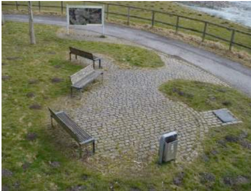
Foto 13 und Foto 14: Rastplatz RuhrtalRadweg an der Dinscheder Brücke und Brücke