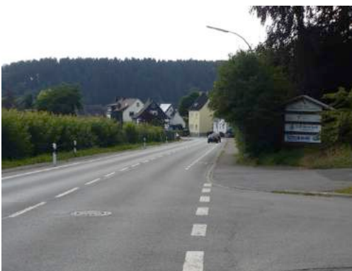
Foto 65 und Foto 66: Ortseingangsbereiche an der Oeventroper Straße