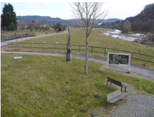
Foto 43 und Foto 44: Abschnitt des RuhrtalRadwegs zwischen Dinscheder Brücke und Glösingen