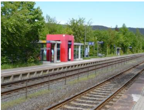
Foto 11 und Foto 12: Bahnhof Oeventrop und Hinweistafel RuhrtalRadweg

aus verfügt Oeventrop mit der RegioBus-Linie R71 über eine stündliche Anbindung nach Freinohl und Meschede bzw. nach Arnsberg. Während diese Linie wochentags zwischen 6.00 und 20.00 Uhr verkehrt, ist das Angebot am Wochenende sehr stark ausgedünnt und verkehrt sonntags nur viermal am Tag. Über die Nachtbus-Linie N3 besteht von Freitag- bis Sonntagabend eine Anbindung zwischen 19.00 und 3.00 Uhr, die im 2-Stunden-Takt Oeventrop mit Arnsberg bzw. Meschede, Bestwig und Olsberg verbindet. Während die zentralen Bereiche Oeventrops noch gut an das ÖPNV-Netz angebunden sind, sind die Entfernungen zur nächsten Bushaltestelle insbesondere für die Wohngebiete in den Hanglagen Oeventrops und Dinschedes teilweise sehr weit.