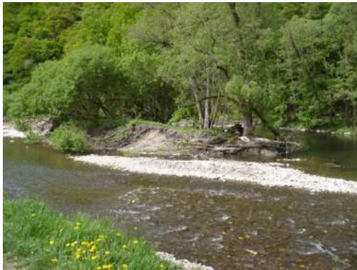
Foto 15 und Foto 16: Renaturierter Ruhrbereich und Spielplatz „Appelhof“

zugang, der bei der Freizeitgestaltung der Bürger eine wichtige Rolle als Naherholungsraum spielt. Das Waldgebiet rund um Oeventrop verfügt über eine Vielzahl von Rad- und Wanderwegen. Der Ortsverein Oeventrop des Sauerländischen Gebirgsvereins (SGV) kümmert sich ehrenamtlich um die Pflege und Beschilderung der Wege. Darüber hinaus ist er bei der Entwicklung und Markierung neuer Wanderwege aktiv. In Eigenarbeit wurde so bspw. der Panoramaweg Oeventrop entwickelt, beschildert und mit Bänken ausgestattet. Dieser Weg bietet viele attraktive Aussichtspunkte auf den Ortsteil und ins Ruhrtal und erfreut sich großer Beliebtheit.