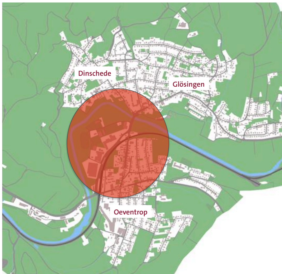
Karte 1: Lage des Untersuchungsgebietes Ortskern Oeventrop innerhalb des Stadtteils