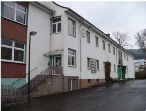
Foto 47 und Foto 48: Gebäude der ehemaligen Hauptschule und Außenfläche