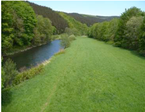
Foto 41 und Foto 42: Abschnitt der neuen Wegeführung des RuhrtalRadwegs