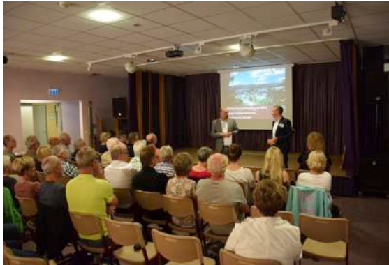
Foto 9 und Foto 10: Projektmesse am 28.06.2018

chen. Die für das DIEK OEVENTROP relevanten Themen wurden gesammelt und entsprechend in der Maßnahmenentwicklung berücksichtigt.