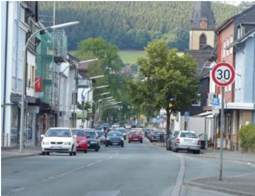
Foto 35 und Foto 36: Straßen mit und ohne Radfahrstreifen in Oeventrop