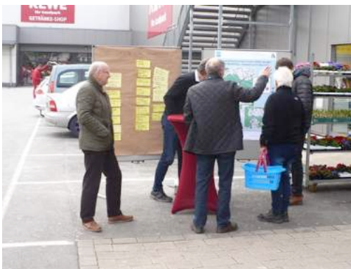
Foto 5 und Foto 6: Infostand am 09.03.2018 und Ortsrundgang am 13.04.2018