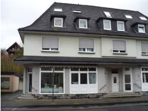
Foto 67 und Foto 68: Impressionen des Wohnungsangebotes in Oeventrop