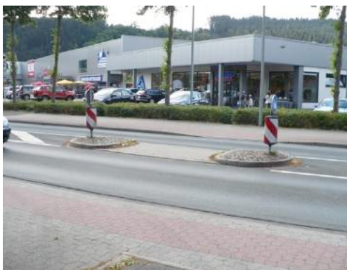
Foto 59 und Foto 60: Fußläufige Verbindung Kirchstraße - Widay-Markt

Zusätzlich sollte die vorhandene Querungshilfe, z. B. durch einen Zebrastreifen aufgewertet und damit eine Querung des Widayweges erleichtert werden. Weiterhin könnte der Weg auch für Fahrradfahrer ausgebaut werden, um den Umweg über die Kreuzung Widayweg/ Kirchstraße abzukürzen.