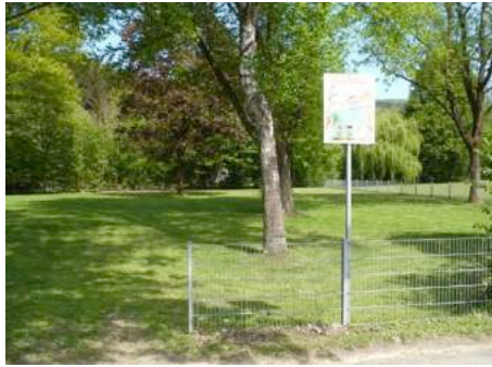
Foto 31 und Foto 32: Mögliche Flächen für einen Bikepark im Sportzentrum