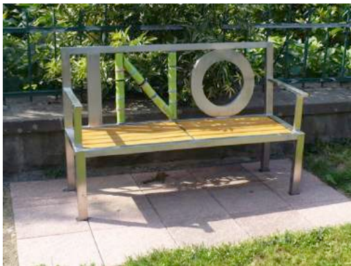
Foto 19 und Foto 20: Aufgestellte Bank der Initiative Oeventrop und Grundschule Dinschede

Das große bürgerschaftliche Engagement Oeventrops zeigte sich insbesondere im Zuge der Flüchtlingshilfe seit dem Jahr 2015. Nachdem die kleine Sporthalle im Sportzentrum „In den Oeren“ durch die Stadt Arnsberg als Flüchtlingsunterkunft hergerichtet wurde, gründeten Ehrenamtliche aus Oeventrop die Flüchtlingshilfe Oeventrop, in der sich über 160 Bürger für eine Betreuung, Unterstützung und Integration der Flüchtlinge im Ortsteil bemühten. Es gründeten sich verschiedene Arbeitsgruppen, die sich um verschiedene Themen gekümmert haben. So wurden bspw. eine Kleiderkammer, eine Fahrradwerkstatt und im Jahr 2017 der Oeventroper Treff als Anlauf- und Kommunikationspunkt ins Leben gerufen. Angesiedelt und bis heute betrieben werden viele dieser Angebote im Gebäude der ehem. Hauptschule. Trotz zurückgehender Flüchtlingszahlen und der Aufgabe der Unterkunft in der Sporthalle sind noch viele Oeventroper in der Flüchtlingshilfe aktiv und unterstützen weiterhin die Flüchtlinge bei ihrer Integration.