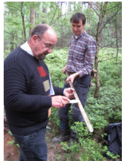
Beurteilung der Bodeneigenschaften durch den Geologischen Dienst NRW

Die Arbeiten sind Teil der forstlichen Standortkartierung, die vom Landesforstgesetz für sämtliche Wälder des Landes vorgeschrieben ist und seit vielen Jahren in Nordrhein-Westfalen durchgeführt wird.