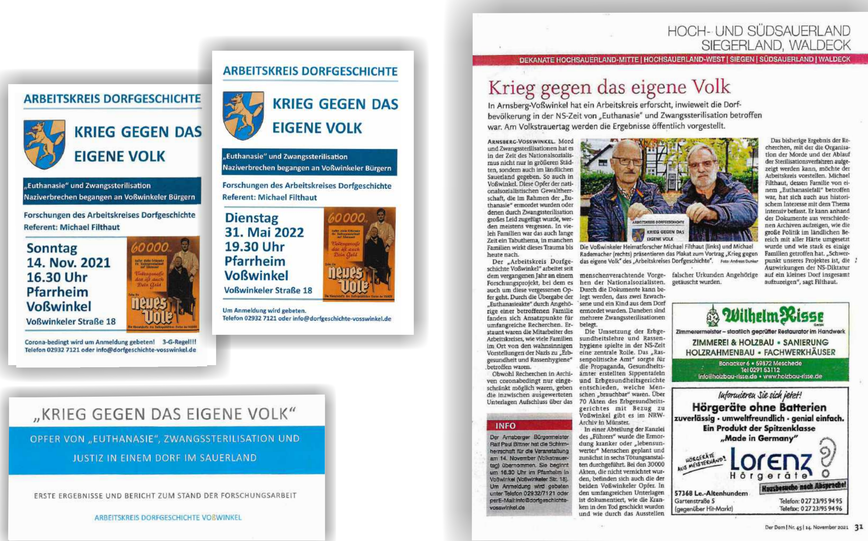
Folienvortrag, Zeitungsartikel und Fotos zum Projekt

Die Verbrechen der NS nicht in Vergessenheit geraten lassen. Partei ergreifen für die Opfer, deren Familien zum Teil immer noch nicht über ihr Schicksal sprechen können. Diesen Opfern ein "Gesicht" geben durch entsprechende Veröffentlichungen und Aufstellen einer Gedenktafel am Vosswinkel Ehrenmal. Damit trägt das Projekt zum Globalen Nachhaltigkeitsziel 4 „Hochwertige Bildung“ bei.