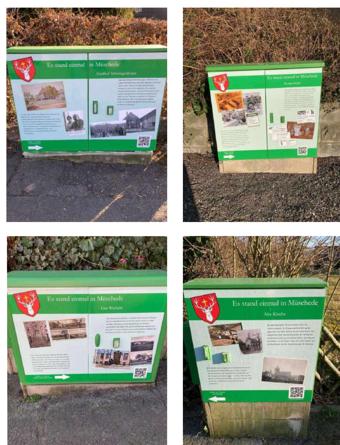
Info zum Rundweg und Fotos der Folien