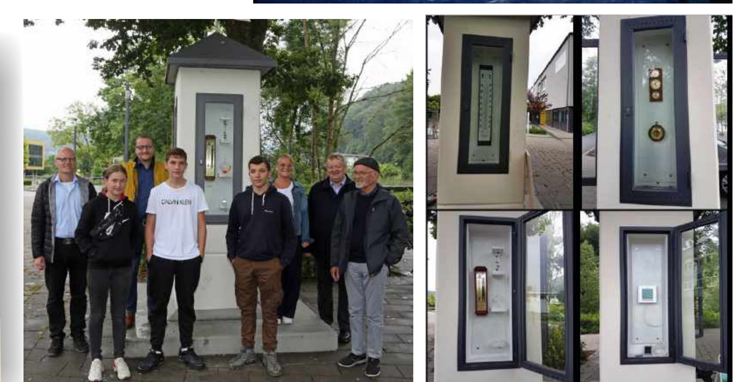
Zeitungsartikel von 1982 und Fotos der Wettersäule