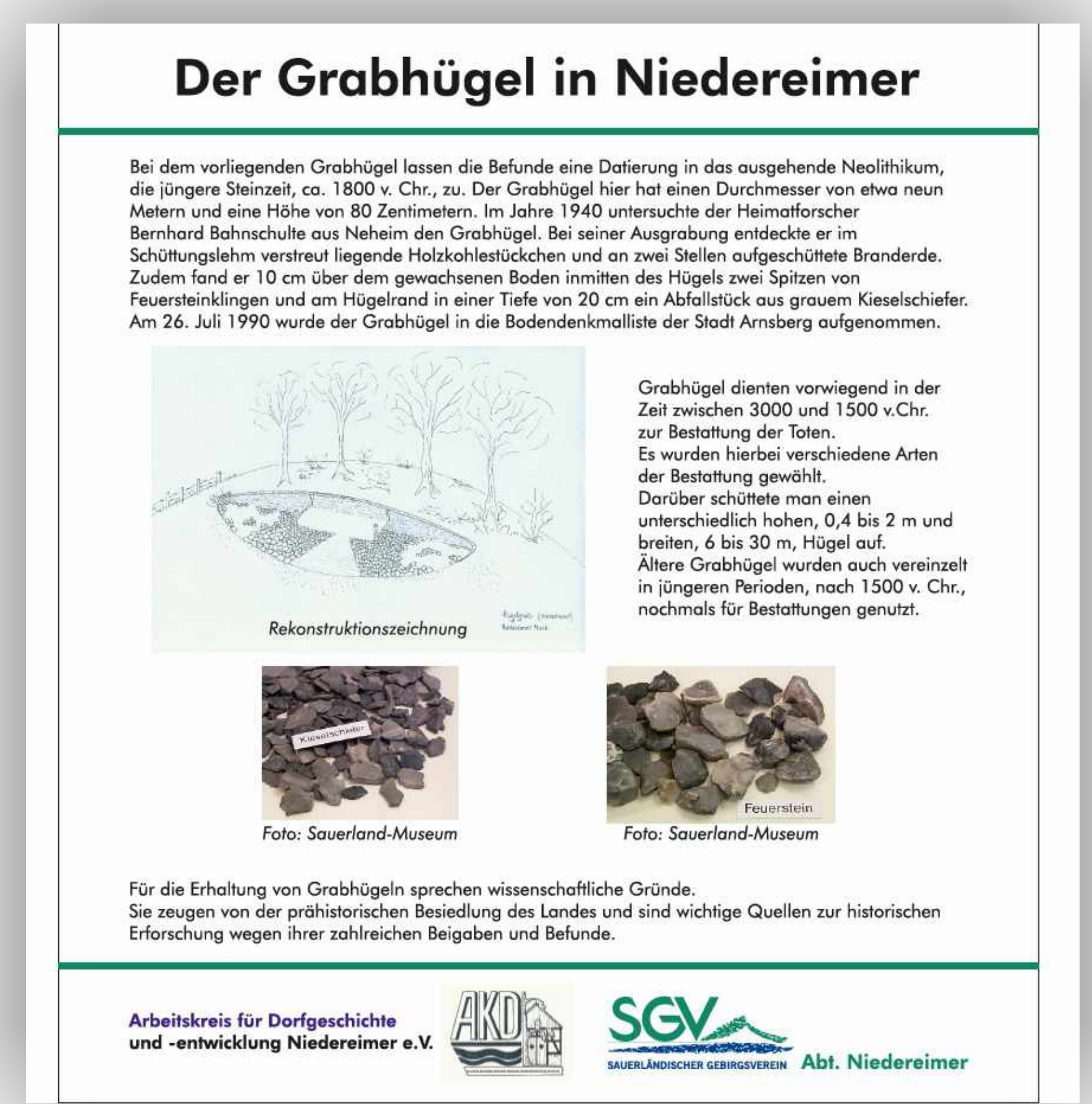
Hinweistafel und Fotos zum Projekt

Nach der erfolgreichen Auslobung des HEIMAT-PREIS-ARNSBERG in den vergangenen Jahren hat die Stadt Arnberg auch in diesem Jahr wieder einen Heimat Preis vergeben. Damit werden zum vierten Mal in Folge Initiativen ausgezeichnet, die sich in besonderer Weise um die Darstellung bzw. Recherche der Heimatgeschichte Arnbergs bzw. eines Ortsteils verdient gemacht haben.